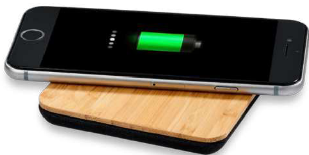
124118 | BASE DE CARGA INALÁMBRICA DE 5 W DE HOJAS DE BAMBÚ Y TELA "LEAF" | Madera de bambú | 9 x 9 x 1 cm | 2.666 kg CO 2 e