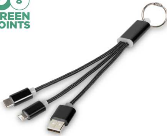
134961 | CABLE DE CARGA 3 EN 1 CON LLAVERO "METAL" | Aluminio | 20 x 3.9 x 0.8 cm | 2.583 kg CO 2 e