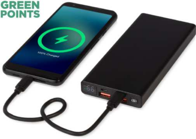
124313 | BATERÍA EXTERNA DE ALUMINIO PD DE 10 000 MAH Y 22,5 W "HYBRID" | Aluminio | 14.6 x 6.5 x 1.5 cm | 3.743 kg CO 2 e