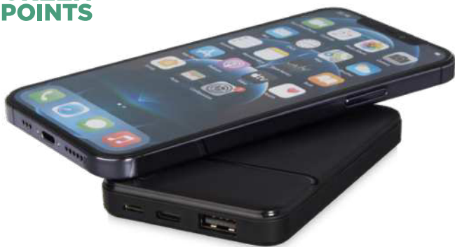
124202 | BATERÍA EXTERNA DE PLÁSTICO RECICLADO DE 5000 MAH "LOOP" | Plástico ABS reciclado | 9.9 x 6.3 x 1.4 cm | 2.748 kg CO 2 e