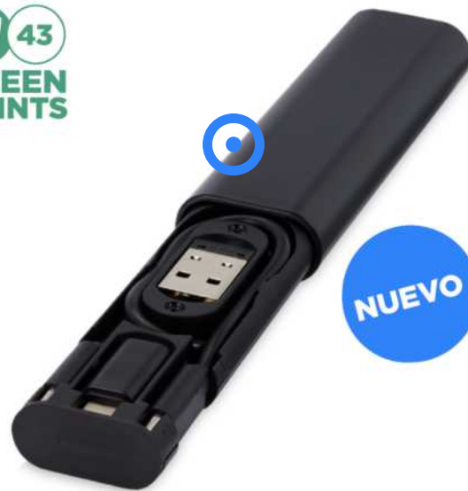
124362 | CABLE DE CARGA MODULAR DE PLÁSTICO RECICLADO "WHIZ" | Plástico ABS reciclado | 10.5 x 1.5 x 1.5 cm | 2,523 kg CO 2 e