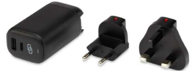
124328 | CARGADOR DE VIAJE PD DE 25 W DE PLÁSTICO RECICLADO "ADAPT" | Plástico PCR | 11.7 x 4.6 x 5 cm | 2.81 kg CO 2 e