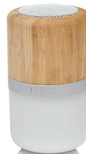
124151 | ALTAVOZ DE BAMBÚ CON BLUETOOTH® Y LUZ "AUREA" | Madera de bambú - Plástico ABS | Ø 6.4 x 10.6 cm | 2.882 kg CO 2 e