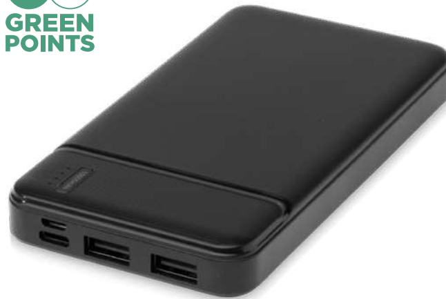
124321 | BATERÍA EXTERNA DE PLÁSTICO RECICLADO DE 10 000 MAH "LOOP" | Plástico ABS reciclado | 13.6 x 6.8 x 1.5 cm | 3.1 kg CO 2 e