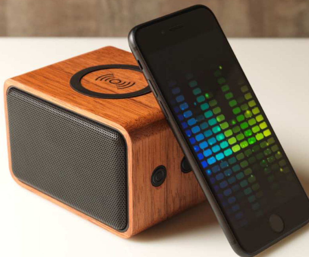
124007 | ALTAVOZ CON BASE DE CARGA INALÁMBRICA DE 3 W "WOODEN" | Plástico ABS | 10.8 x 7 x 7.8 cm | 3.344 kg CO 2 e