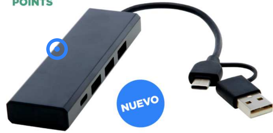
124344 | HUB USB 2.0 DE ALUMINIO RECICLADO CON CERTIFICACIÓN RCS "RISE" | Recycled Aluminium | 10 x 3 x 1.2 cm | 2.60 kg CO 2 e