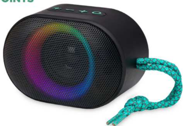
124181 | ALTAVOZ DE EXTERIOR IPX6 CON LUZ AMBIENTAL RGB "MOVE" | Plástico ABS | 11 x 7.4 x 7.4 cm | 3.324 kg CO 2 e