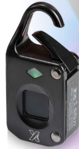
2PX031 | SCX.DESIGN T10 CANDADO HUELLA DIGITAL | Aleación de zinc | 2.8 x 6 x 1.5 cm | 2.659 kg CO 2 e ●