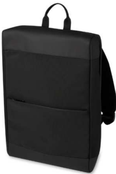
120697 | MOCHILA PARA PORTÁTIL DE 15,6" DE MATERIAL RECICLADO GRS "RISE" | Poliéster reciclado con certificado GRS | 28 x 43 cm | 0 kg CO 2 e