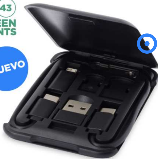
124361 | CABLE DE CARGA MODULAR DE PLÁSTICO RECICLADO CON SOPORTE PARA TELÉFONO "SAVVY" | Plástico ABS reciclado | 8.5 x 5.5 x 3 cm | 2,536 kg CO 2 e