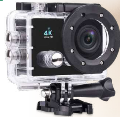
2PA204 | PRIXTON CÁMARA MULTI-SPORT 4K | Plástico ABS | 7.5 x 6 x 4.2 cm | 2.961 kg CO 2 e