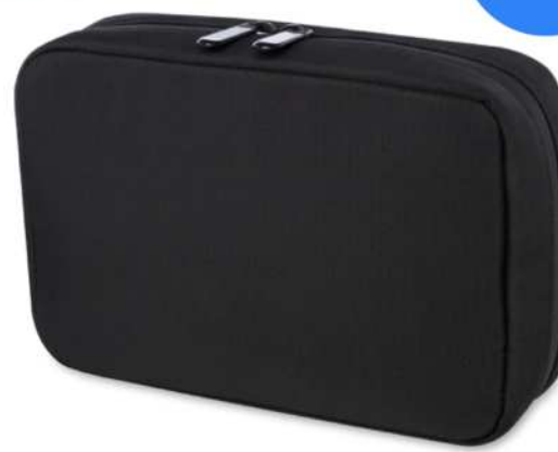
120698 | BOLSA ORGANIZADORA DE MATERIAL RECICLADO GRS "RISE" | Poliéster reciclado con certificado GRS | 21 x 14 cm | 0 kg CO 2 e