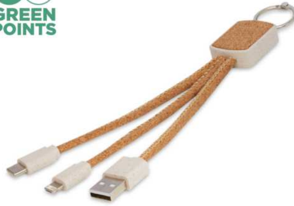
124294 | CABLE DE CARGA 3 EN 1 DE PAJA DE TRIGO Y CORCHO "BATES" | Corcho | 40 x 29 x 28 cm | 2.49 kg CO 2 e