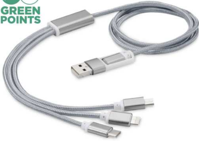
124180 | CABLE DE CARGA 5 EN 1 "VERSATILE" | Cobre revestido de aluminio | Ø 4 x 100 cm | 2.724 kg CO 2 e