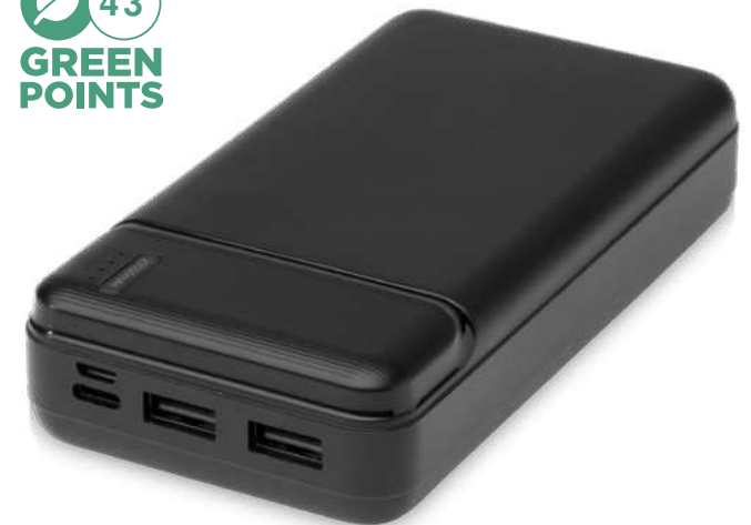
124322 | BATERÍA EXTERNA DE PLÁSTICO RECICLADO DE 20 000 MAH "LOOP" | Plástico ABS reciclado | 13.7 x 6.8 x 2.8 cm | 3.65 kg CO 2 e