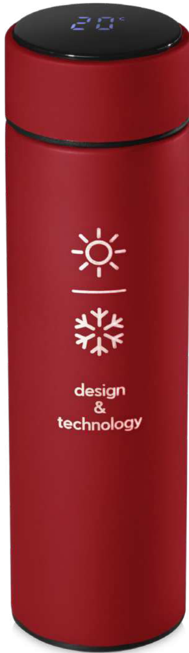
2PX039 | SCX.DESIGN D10 BOTELLA CON AISLAMIENTO TÉRMICO | Acero inoxidable | Ø 6.3 x 23 cm | 1.063 kg CO 2 e ●●●