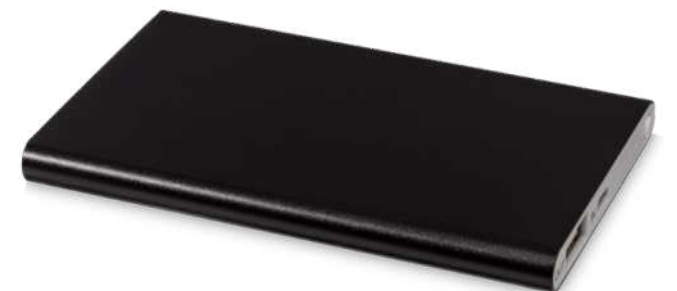
134245 | BATERÍA EXTERNA DE 4000 MAH "PEP" | Aluminio | 10.9 x 6.8 x 0.9 cm | 3.075 kg CO 2 e