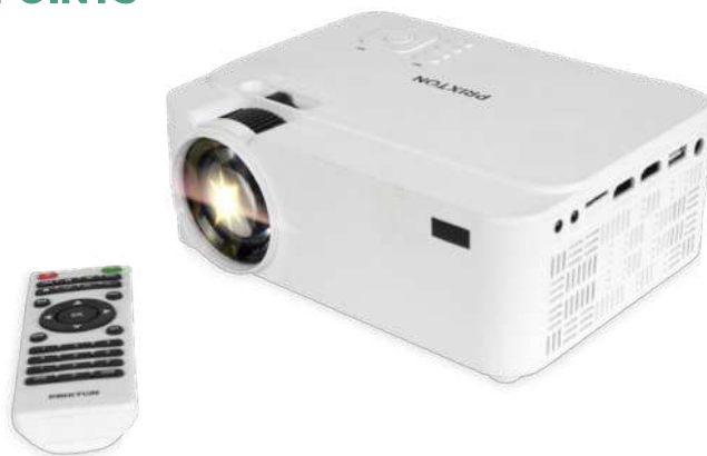
2PA037 | PROYECTOR P10 PRIXTON "GOYA" | Plástico | 20 x 15 x 8.3 cm | 5.703 kg CO 2 e