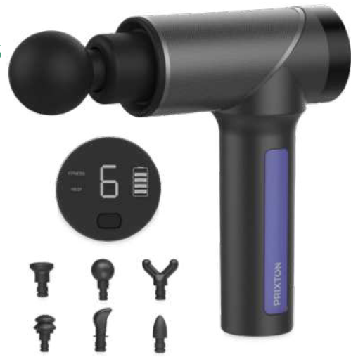
2PA072 | PISTOLA DE MASAJE "PRIXTON MGF100" | Plástico ABS | Ø 6 x 22 x 20 x 6 cm | 5.853 kg CO 2 e