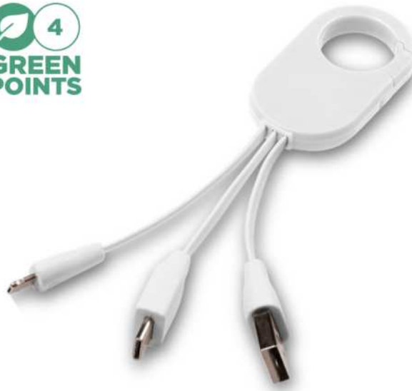
134993 | CABLE DE CARGA 3 EN 1 "TROOP" | Plástico ABS | 0.6 x 3 x 13.5 cm | 2.513 kg CO 2 e