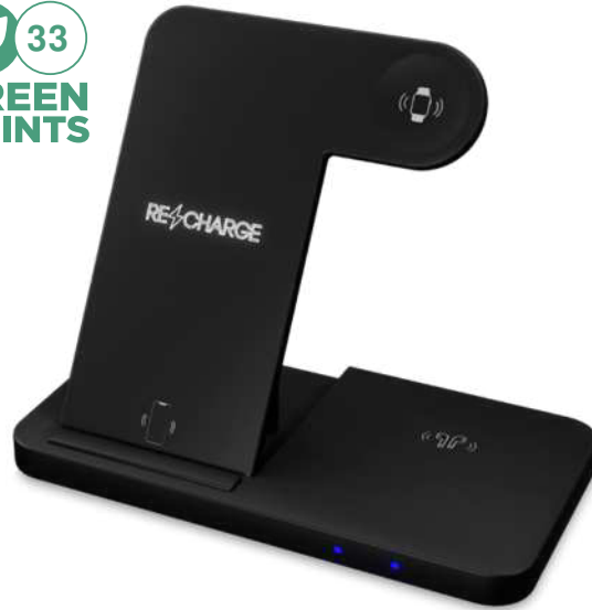
1PX135 | BASE DE CARGA INALÁMBRICA 3 EN 1 CON SOPORTE PARA TELÉFONO "SCX.DESIGN W28" | Plástico ABS reciclado | 19 x 17.5 x 23 cm | 2.83 kg CO 2 e ●