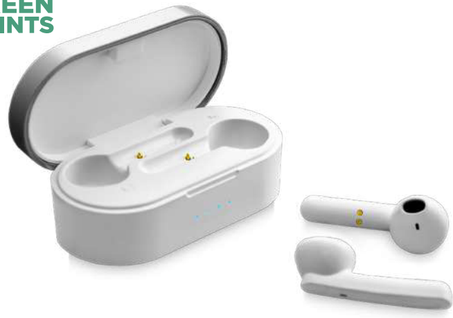
2PA105 | AURICULARES "PRIXTON TWS157" | Plástico ABS | 7.3 x 3.5 x 2.7 cm | 2.622 kg CO 2 e