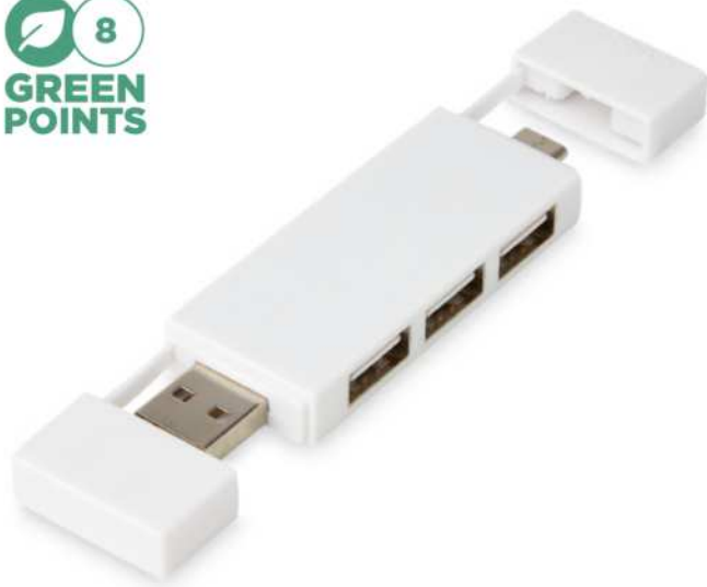
124251 | MULTIPUERTO USB 2.0 DUAL "MULAN" | Plástico ABS | 9 x 2 x 0.9 cm | 2.517 kg CO 2 e