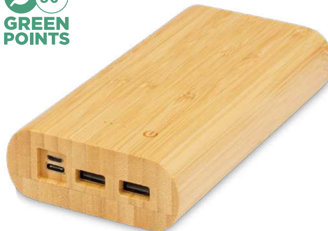
124324 | BATERÍA EXTERNA DE 20,000 MAH DE BAMBÚ "TULDA" | Madera de bambú | 15 x 7.7 x 3 cm | 3.24 kg CO 2 e