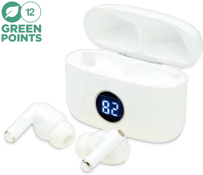
124177 | AURICULARES ANC "ANTON EVO" | Plástico ABS | 6.2 x 4.6 x 2.7 cm | 2.655 kg CO 2 e ○