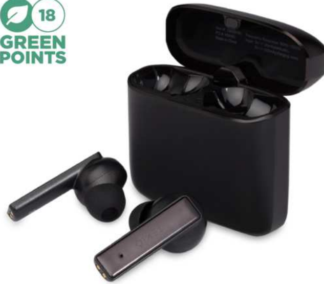
124297 | AURICULARES DE PRIMERA CALIDAD TRUE WIRELESS "HYBRID" | Aleación de zinc | 4.3 x 2.8 x 1.9 cm | 2.714 kg CO 2 e