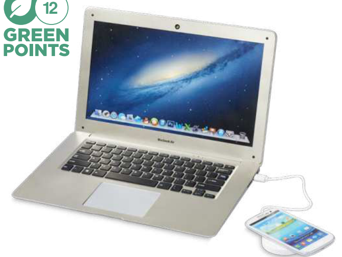
134264 | BASE DE CARGA INALÁMBRICA DE 5 W "FREAL" | Plástico ABS | Ø 6.96 cm | 2.624 kg CO 2 e