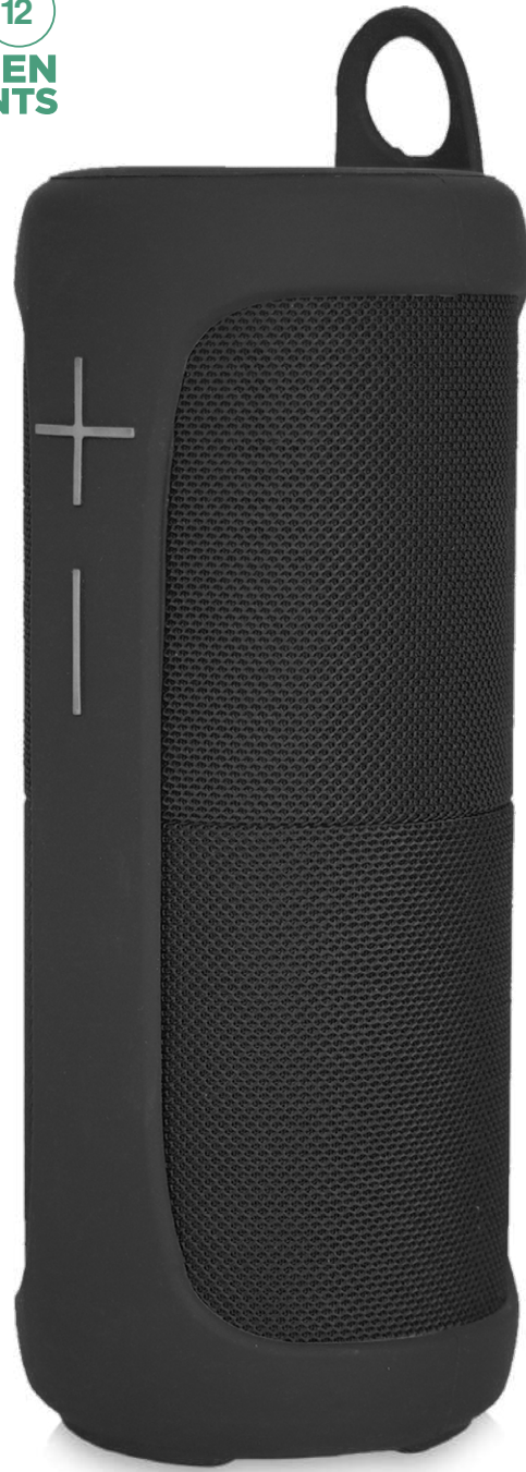
2PA149 | ALTAVOZ BLUETOOTH® "PRIXTON ALOHA LITE" | Plástico | 23.5 x 8.7 x 8.7 cm | 5.049 kg CO 2 e