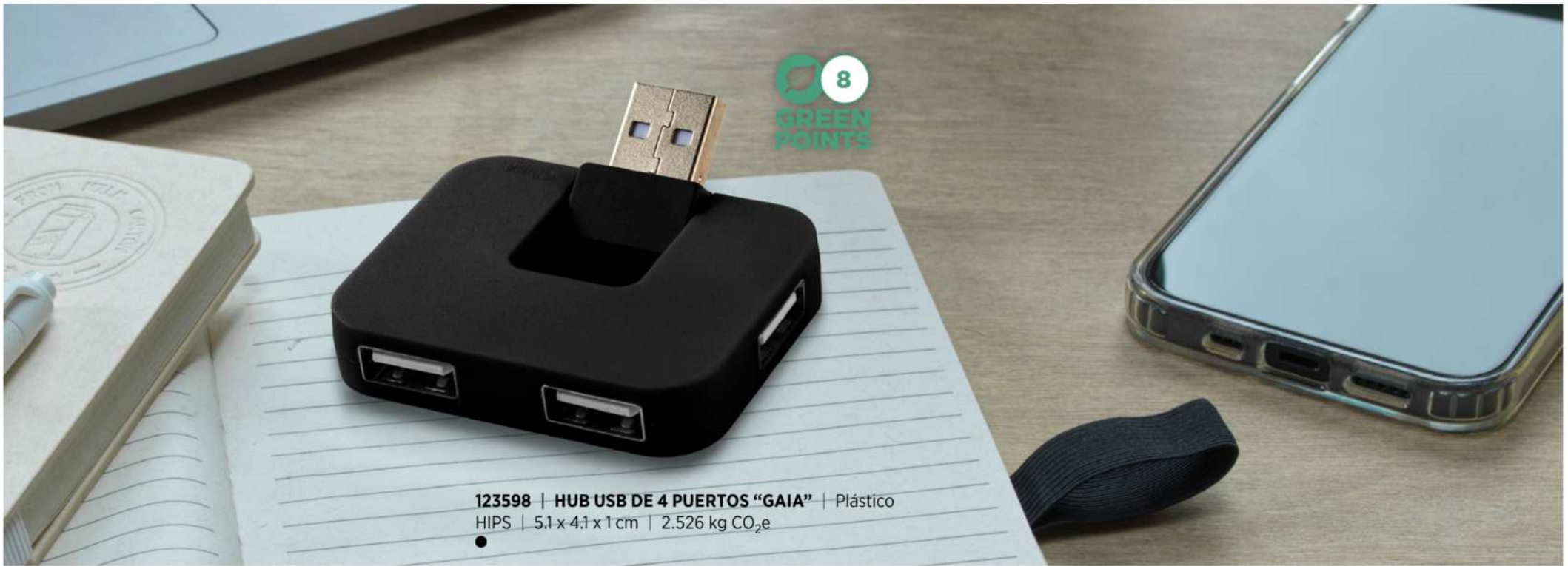
123598 | HUB USB DE 4 PUERTOS "GAIA" | Plástico HIPS | 5.1 x 4.1 x 1 cm | 2.526 kg CO 2 e