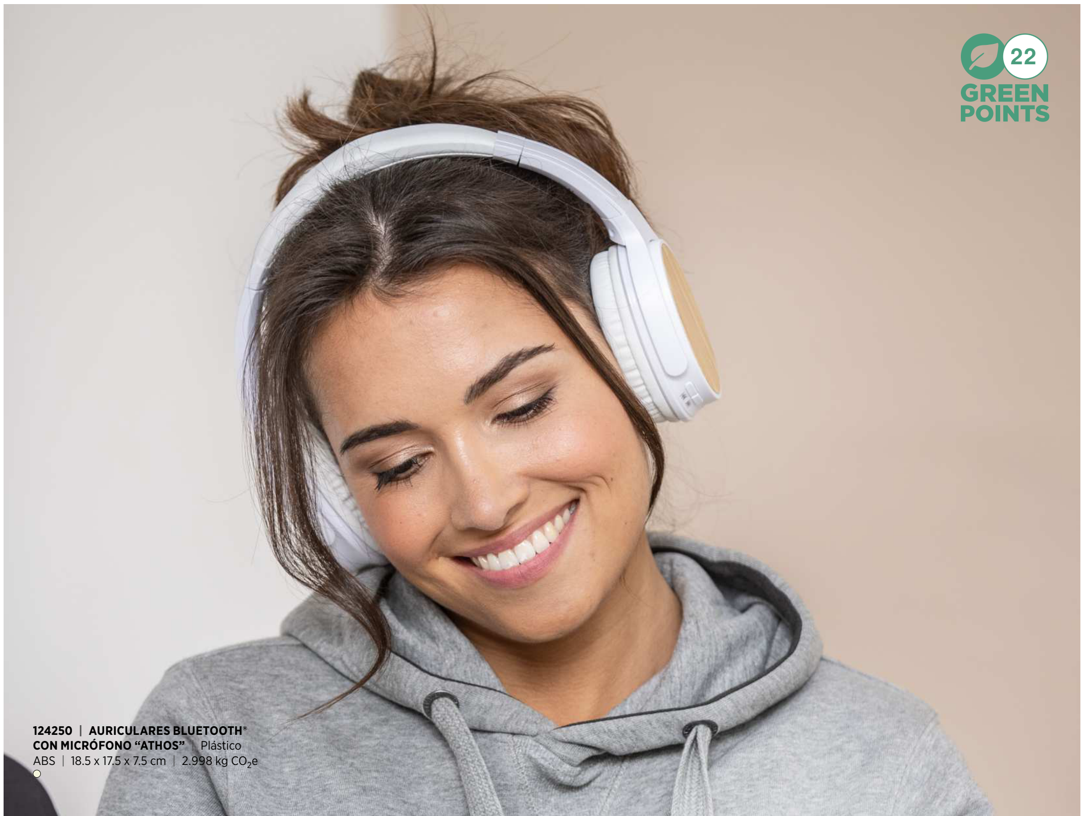
124250 | AURICULARES BLUETOOTH® CON MICRÓFONO "ATHOS" | Plástico ABS | 18.5 x 17.5 x 7.5 cm | 2.998 kg CO 2 e