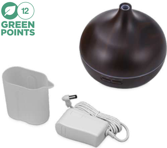
2PA085 | HUMIDIFICADOR PRIXTON "HIDRA" | Plástico - Metal | 15 x 16.5 x 16.6 cm | 4.297 kg CO 2 e