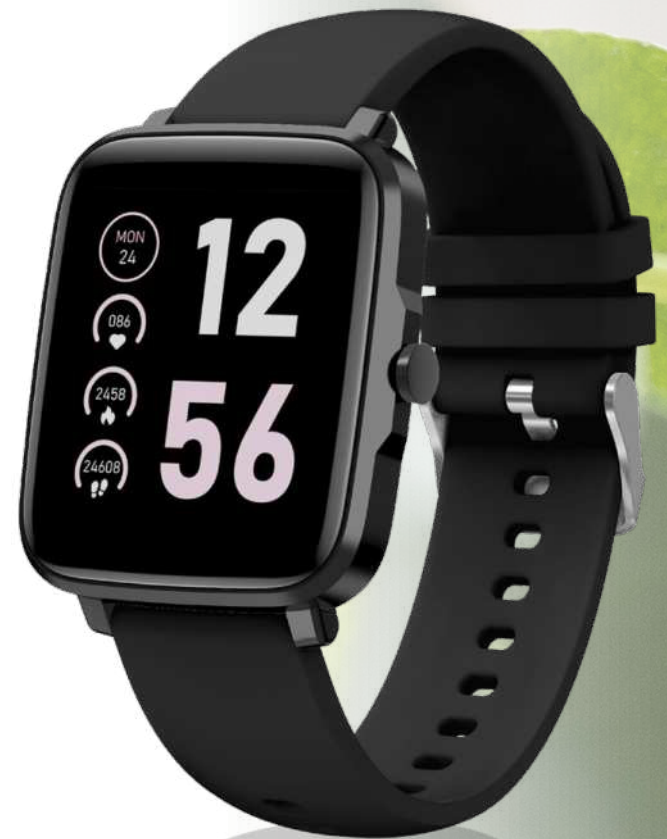
2PA027 | PRIXTON AT803 ACTIVITY TRACKER COLOR CON TERMÓMETRO | Plástico de silicona | 25.5 x 4.1 x 7.5 cm | 2.458 kg CO 2 e