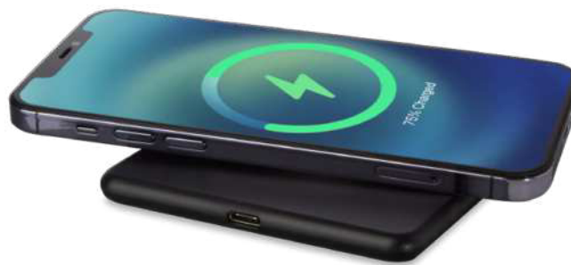
124204 | BASE DE CARGA INALÁMBRICA DE PLÁSTICO RECICLADO DE 10 W "LOOP" | Plástico ABS reciclado | 9 x 9 x 0.9 cm | 2.581 kg CO 2 e