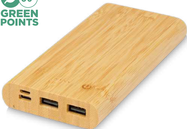
124323 | BATERÍA EXTERNA DE 10,000 MAH DE BAMBÚ "TULDA" | Madera de bambú | 14.9 x 7 x 1.8 cm | 2.87 kg CO 2 e