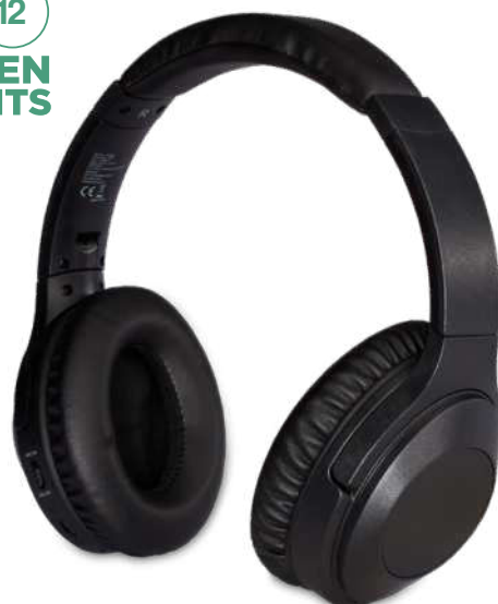
124158 | AURICULARES ANC "ANTON" | Plástico ABS | 16.5 x 8 x 18.5 cm | 3.282 kg CO 2 e