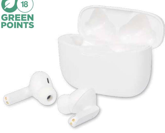
124290 | AURICULARES INALÁMBRICOS CON EMPAREJAMIENTO AUTOMÁTICO TRUE WIRELESS "ESSOS 2.0" | Plástico ABS | 6.3 x 4.8 x 2.5 cm | 2.588 kg CO 2 e ●