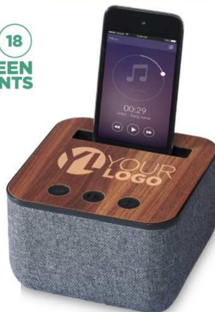
108313 | ALTAVOZ BLUETOOTH® DE MADERA Y TELA "SHAE" | Plástico ABS | 12 x 12 x 7.6 cm | 3.798 kg CO 2 e