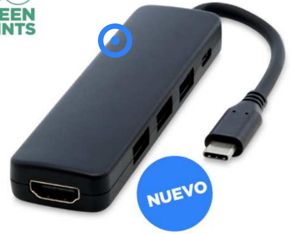
124368 | USB 2.0-3.0 CON ADAPTADOR MULTIMEDIA DE PLÁSTICO RECICLADO CON PUERTO HDMI Y CERTIFICACIÓN RCS "LOOP" | Plástico ABS reciclado | 9 x 3 x 1.3 cm | 2,535 kg CO 2 e