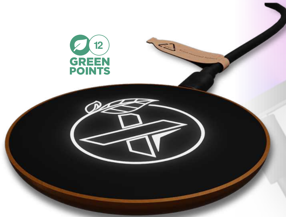
2PX051 | SCX.DESIGN ESTACIÓN DE CARGA INALÁMBRICA DE MADERA W13 10W | Plástico ABS | Ø 6.8 cm | 2.566 kg CO 2 e ●●●