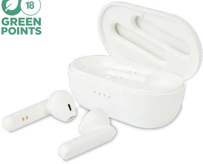
124300 | AURICULARES TWS CON ADITIVO ANTIBACTERIANO "PURE" | Plástico ABS | 7 x 3.8 x 2.9 cm | 2.605 kg CO 2 e ○