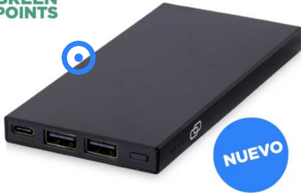
124349 | BATERÍA EXTERNA DE 5000 MAH EN ALUMINIO RECICLADO CON CERTIFICACIÓN RCS "CONNECT" | Recycled Aluminium | 6.5 x 13 x 1.1 cm | 2.81 kg CO 2 e