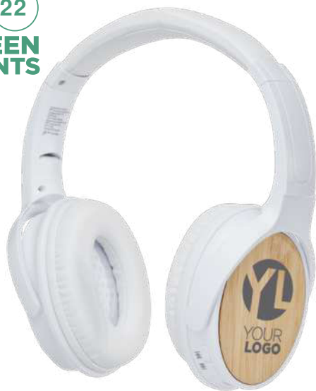
124250 | AURICULARES BLUETOOTH® CON MICRÓFONO "ATHOS" | Plástico ABS | 18.5 x 17.5 x 7.5 cm | 2.998 kg CO 2 e