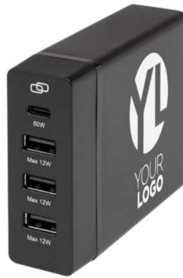
124330 | ESTACIÓN DE CARGA PD DE PLÁSTICO RECICLADO DE 72 W "ADAPT" | Plástico PCR | 9.1 x 7.2 x 2.7 cm | 3.16 kg CO 2 e