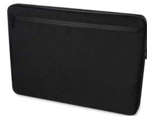
120699 | FUNDA PARA PORTÁTIL DE 15,6" DE MATERIAL RECICLADO GRS "RISE" | Poliéster reciclado con certificado GRS | 41 x 29.5 cm | 0 kg CO 2 e