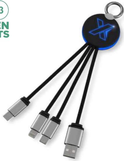
2PX002 | SCX.DESIGN C16 RING LIGHT-UP CABLE RETROILUMINADO | Plástico ABS reciclado | 14 x 3.5 x 1.2 cm | 2.58 kg CO 2 e ●●●