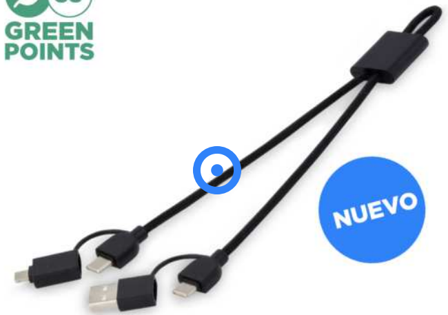
124345 | CABLE DE CARGA RÁPIDA 6 EN 1 DE 45 W EN ALUMINIO RECICLADO CON CERTIFICACIÓN RCS "CONNECT" | Recycled Aluminium | 25 x 1 cm | 2.53 kg CO 2 e