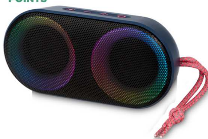
124189 | ALTAVOZ DE EXTERIOR IPX6 CON LUZ AMBIENTAL RGB "MOVE MAX" | Plástico ABS | 16 x 7.8 x 5.1 cm | 3.313 kg CO 2 e