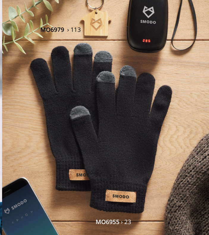
MO6979 > 113