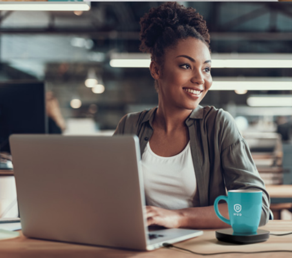
MO2067 > 52