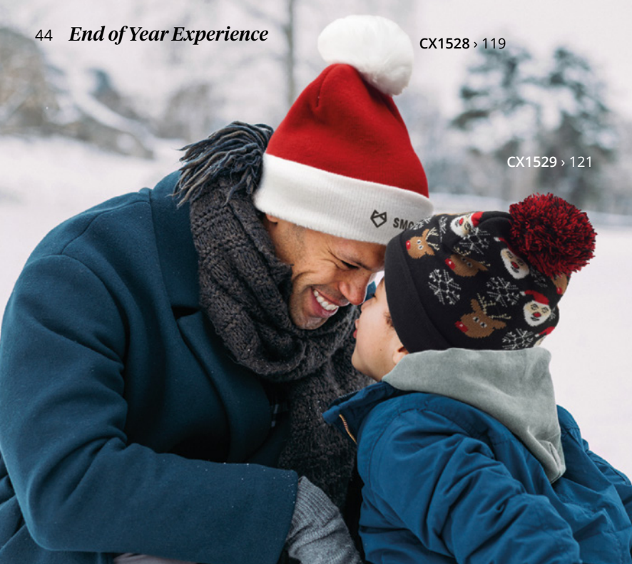
CX1528 > 119