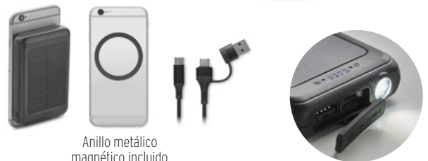
Anillo metálico magnético incluido