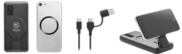
Anillo metálico magnético incluido