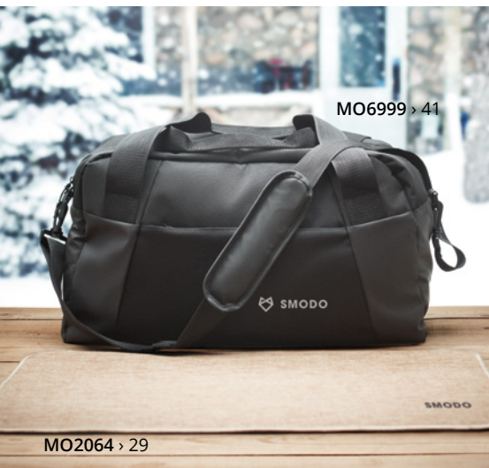
MO6999 > 41

Disfrute de la Navidad con estos accesorios personalizados. Elige o combina estos prácticos guantes táctiles, el calentador de manos 2 en 1 o un gorro como preparación perfecta para unas vacaciones cálidas y acogedoras.